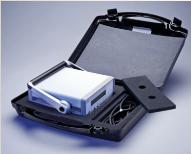
Transportkoffer KAL 100 / 200 Best.-Nr. 9220.0002